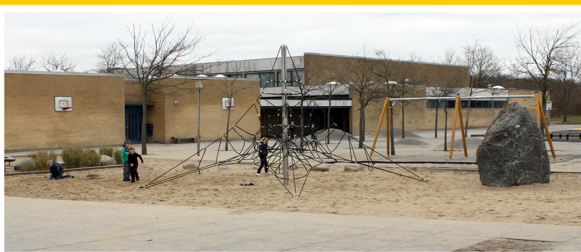
I 2006 blev der gennemført en større modernisering. Legepladserne fik nyt og mere udfordrende inventar, og inde blev de gamle tavler skiftet ud med smart-boards. Herunder er fysiklærer Poul Kårup ved at undervise 9.z. i teorien om pH-værdier.