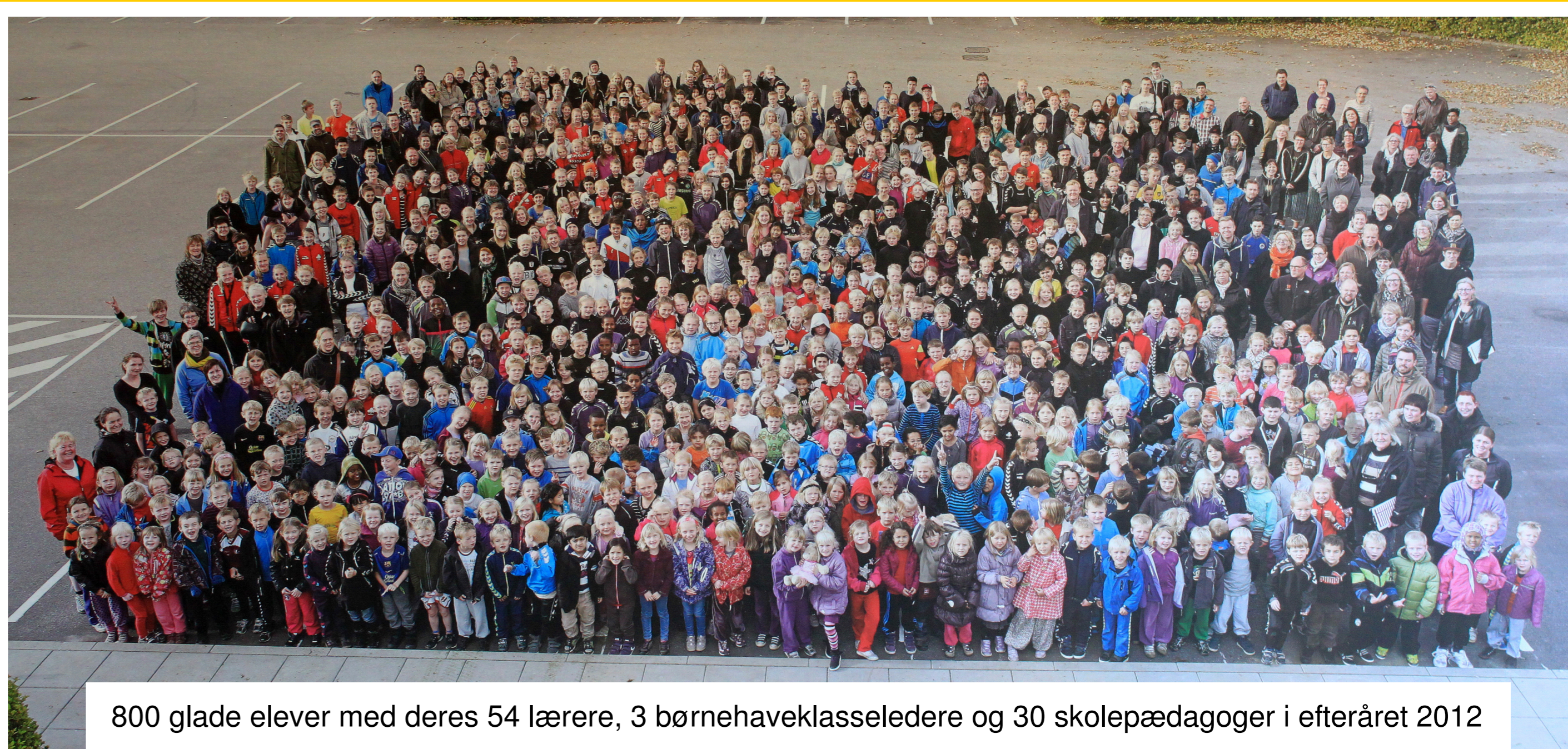
800 glade elever med deres 54 lærere, 3 børnehaveklasseledere og 30 skolepædagoger i efteråret 2012