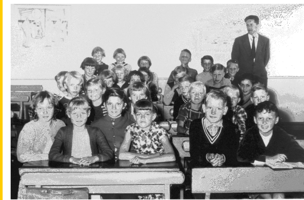
Klassebillede af 4. og 5. Årgang 1956