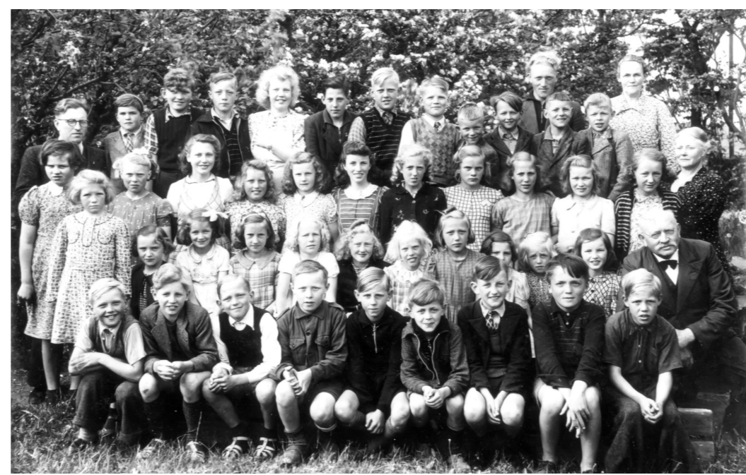
Skolebillede fra ca. 1942

Den seminariueuddannede lærer på den nye skole ved præstegården hed Christian Frederichsen. Til skolen hørte plads til 2 køer og 6 får, og lærerens løn bestod i stor udstrækning af naturalier. Skolen kunne derfor i 1860 sælges som landbrug og fik navnet Skovgaard. De fleste materialer til skolebyggeriet i 1816 blev leveret af ejeren på Skaarupgaard. De var fra en nedrevet lade. Skovgaards jorder blev senere udstykket til Elleparken, og gården brændte i 1967.