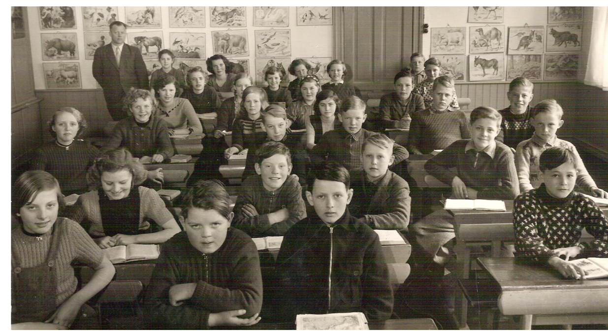
Klassebillede af 3. klasse (de store elever) 1951