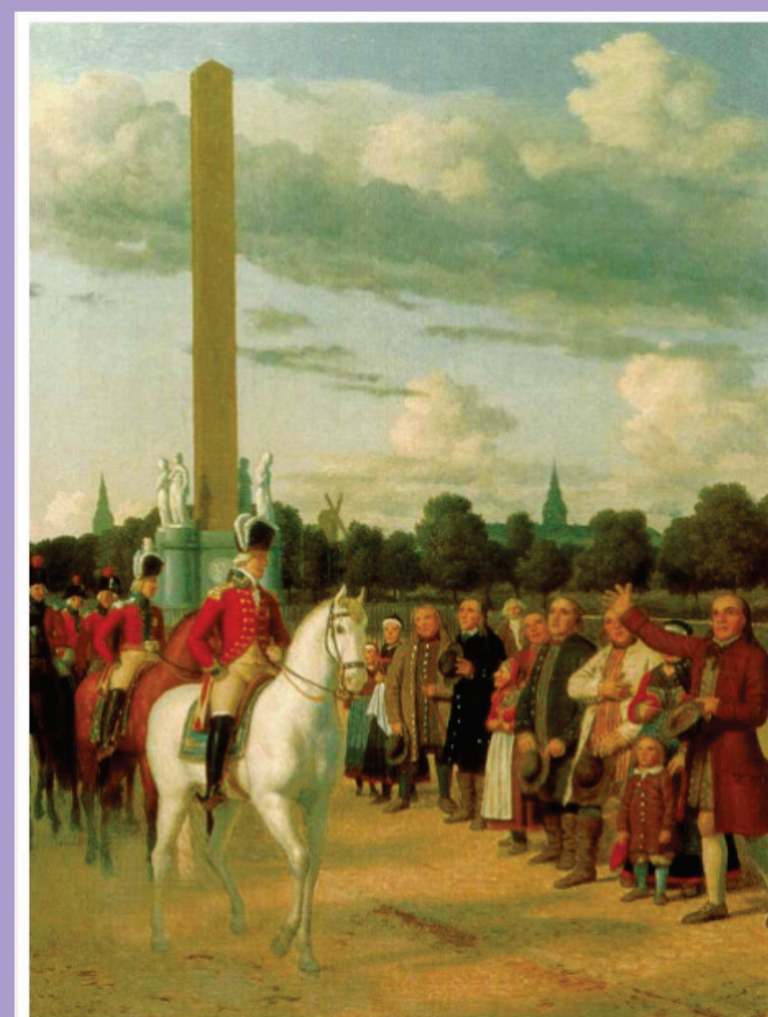
Christoffer Wilhelm Eckersberg: Christian d. 7. Ved Frihedsstøtten

I alt har Elsted sogn 3 kirkebøger, hvor vi kun har bevaret et eksemplar. - Foruden vores jubilar fra 1620 til 1801, en fra 1771 til 1801, som er supplement med fødte og døde, der ikke har været plads til i 1620 bogen og en fra 1802 til 1813 ligeledes kun med fødte og døde.