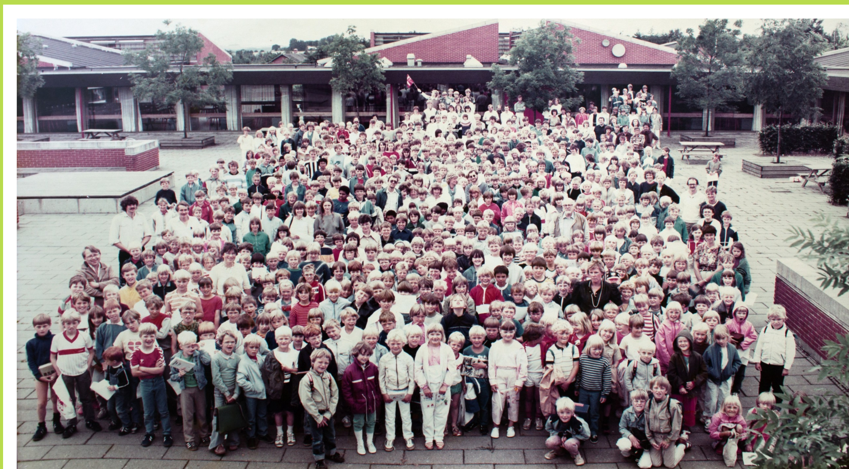
Elever og lærere forsamlet i skolegården ved 10-års jubilæet i 1984