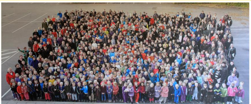
800 glade elever med deres 54 lærere, 3 børnehaveklasseledere og 30 skolepædagoger i efteråret 2012