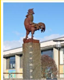
Erik Heides Hane på sokkel er Elsted skoles logo.