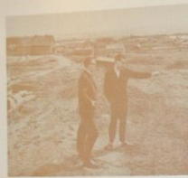
Salg af grundstykke i Hedekov i januar 1962 i Dagligstuen