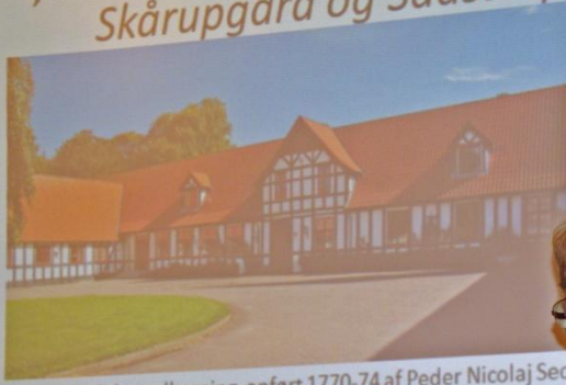
Skårupgårds hovedbygning, opført 1770-74 af Peder Nicolaj Sech