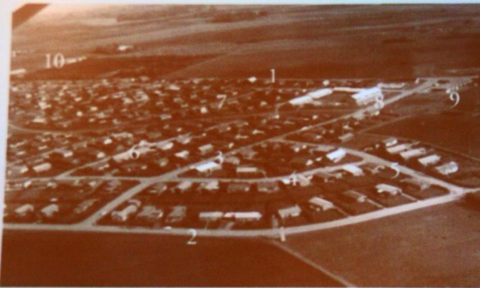
Lufifoto fra 1966: 1: Lystrupvej, 2: Lille Elstedvej, 3: Bystavnet, 4: Per Kjals Vej, 5: Bakkehaldet, 6: Slænbakken, 7: Gyvelbakken, 8: Lystrup Bibliotek, 9: Handelscentret, 10: Elsted skole